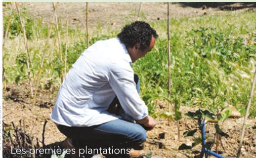
Les premières plantations

Le projet "Jardin partagé de Celleneuve" a démarré : l'association est créée, la mairie a préparé le terrain situé square des Escarcelliers.