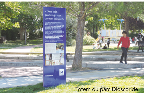
Totem du parc Dioscoride